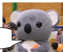
横浜市子ども虐待防止のシンボルキャラクター「キャッピー」です!

赤ちゃんは泣くのが仕事ですが、我が子の泣き声でイライラしてしまった経験はありませんか。「あやす」「授乳やオムツ交換をする」「散歩に出る」など、工夫しておられることと思います。でも、何をしても泣き止まない、どうしても我慢できない時は「その場からちょっと離れる」「お茶を飲む」などしてみましょう。又、泣かせると通報されるのでは、と気になる時はご近所の方とお会いした時に「夕方になると泣くのです」などこちらからお伝えするのも一つの方法です。「家では泣いてばかりなのに、ラフルールに来るとおとなしいです」とおっしゃる方も多くいますが、お子さんがよく泣く時間帯にラフルールに来ていただくのも良いかもしれません。ラフルールは泣き声大歓迎!! 機嫌の悪い赤ちゃん・お子さん大歓迎!! いつでもお待ちしております。