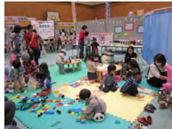
青葉区福祉保健センターから虐待防止のパネル展示もありました