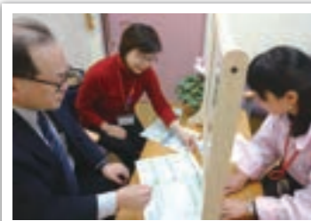
地域ケアプラザでの相談支援