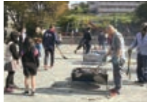
地域のイベントで地域の方々と交流

A 月初めの休日に2時間程度かけて、地域を回っています。見守り対象者の自宅を一軒一軒訪ね、玄関先で少し話をしています。